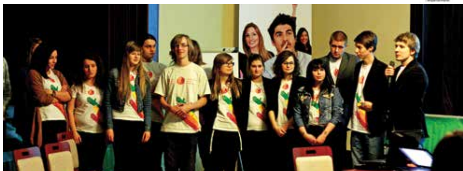
Wolontariusze TCW opowiedzieli o swojej pracy i zdobytym doświadczeniu.

medialny, stwarzając tym samym optymalne warunki do działania. W ramach projektu wolontariusze przeszli liczne szkolenia i warsztaty organizowane po obu stronach Olzy, mając okazję na doskonalenie swoich umiejętności nie tylko w zakresie organizacji imprez, ale także w samoprezentacji, w publicznym wypowiedzeniu się czy biorąc udział w kursie podstaw języka czeskiego. Na uwagę zasługuje również aktywność własna wolontariuszy, którzy w tej dziedzinie dali się poznać jako samodzielni i sprawni organizatorzy kilkunastu przedsięwzięć zrealizowanych w przestrzeni publicznej obu miast. Pokłosiem projektu są dwujęzyczne publikacje elektroniczne: podręcznik metodyczny opisujący formy i metody działania z młodzieżą wolontariacką oraz podręcznik procedur związanych z organiza-