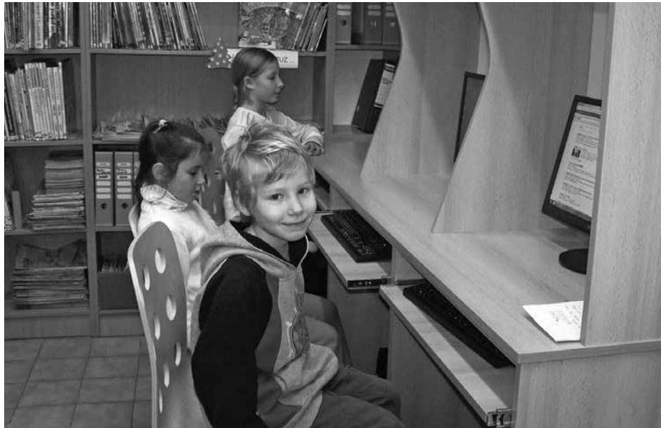
Dzieci mogą bezpłatnie korzystać z komputerów podłączonych do sieci internet w Multimedialnym Centrum Informacyjnym.