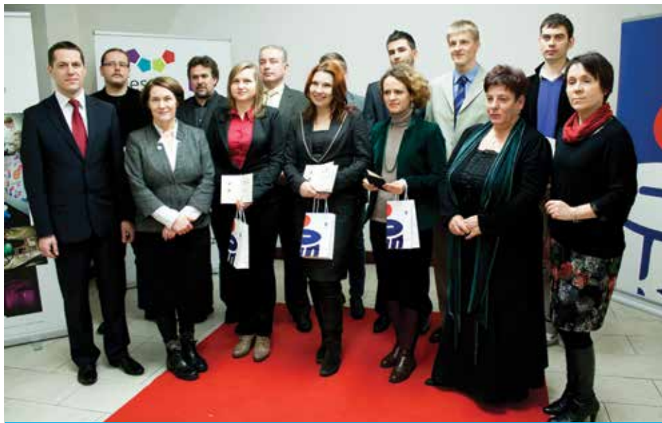
Paszportami Przedsiębiorcy wyróżniono 11 lokalnych firm.