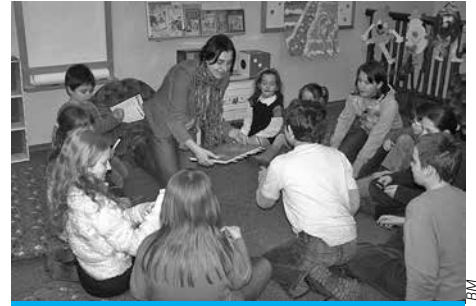
Biblioteka ma ciekawe pomysły na spędzenie ferii zimowych.