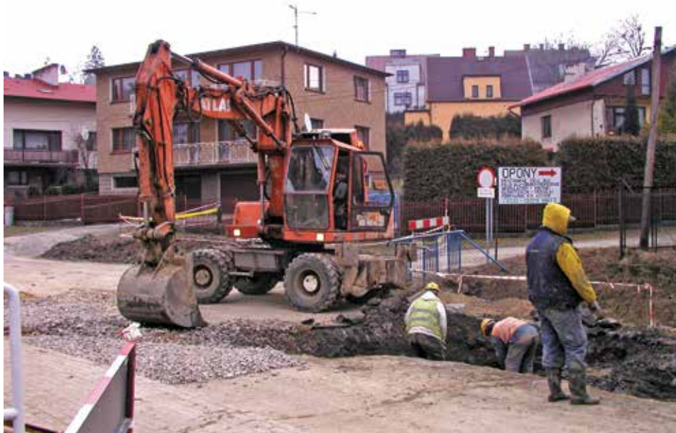
Szacuje się, że w rejonie ulic Wiejskiej, Powstańców Śląskich, Wierzbowej, Nikłej, Skośnej, Małej i Złotej z kanalizacji sanitarnej będzie korzystało ok. 260 osób.

naturalne, zgodnie z ideą zrównoważonego rozwoju. Program przewiduje szereg przedsięwzięć chroniących środowisko naturalne i przywracające stan pierwotny.