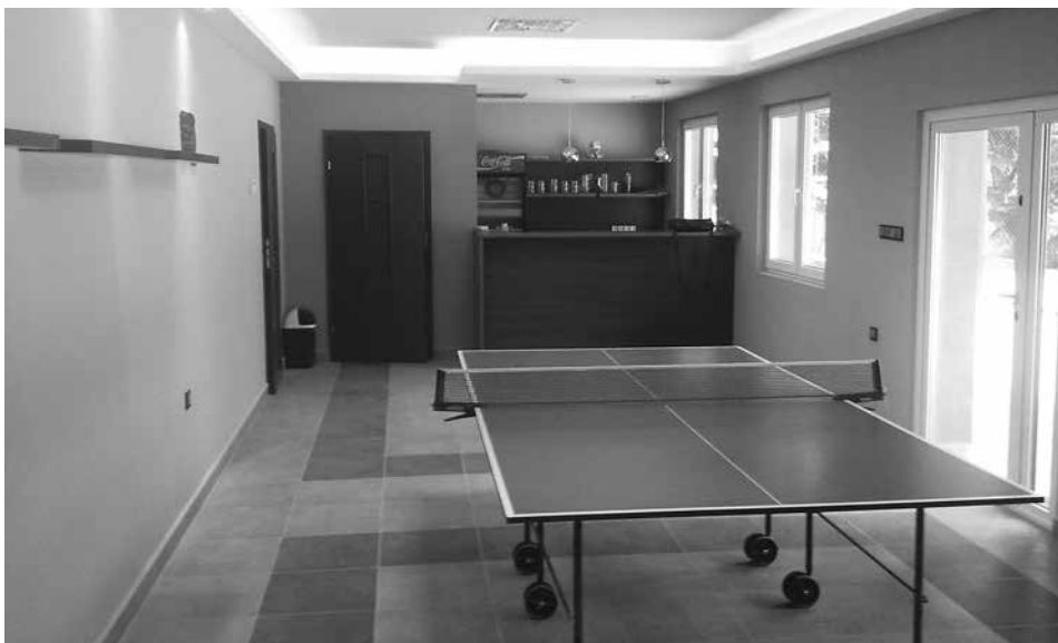
Zmodernizowany budynek klubowy na kortach TKKF „Ogniwo”.

W 2012 roku Ognisko TKKF „Ogniwo” oraz TJ Slavoj z Czeskiego Cieszyna wspólnie realizowali projekt „Tenis bez granic”.