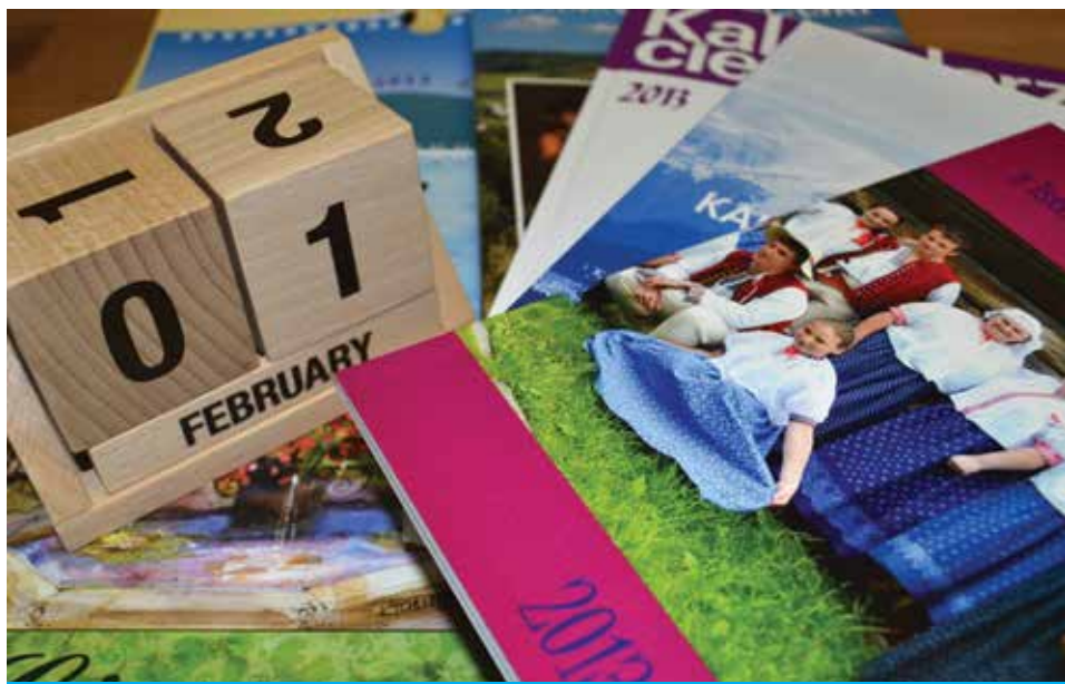
Kalendarz Cieszyński i inne regionalne kalendarze można kupić w Informacji na Wzgórzu Zamkowym.

Wystarczy wstąpić do zamkowego sklepu w Informacji Turystycznej. Można w nim znaleźć Kalendarz Cieszyński, wydawany przez Macierz Ziemi Cieszyńskiej, jak i Kalendarz Śląski, który ukazuje się dzięki Polskiemu Związkowi Kulturalno-Oświatowemu w Republice Czeskiej. Z kolei Towarzystwo Przyjaciół Bielska Białego i Podbeskidzia we współpracy z Towarzystwem Miłośników Ziemi Bielsko-Bialskiej wydało Kalendarz Beskidzki, a Związek Podhalan Odział Górali Śląskich – Kalendarz z Istebnej, Jaworzynki i Koniakowa. Każde z nich to zbiór wyjątkowych opowieści. A może przez cały rok cieszyć oczy cieszyńskimi